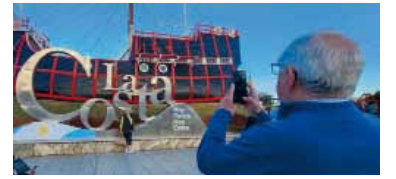
La denominación de "La Costa" viene de 1978.