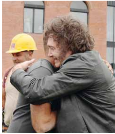
Milei visitó el polo industrial.

En modo campaña, el Presidente cerró la gira en Mar del Plata