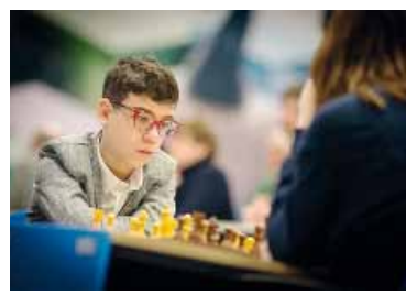
Mala racha. “Fausti” no levanta.

Córdoba, San Juan y Santiago del Estero se consolidan como plazas habituales del rugby internacional, mientras que Vélez, Jujuy y Mendoza ratifican su relevancia en la gira nacional de “Los Pumas”. La combinación de partidos por el Nations Championship, test-matches ante potencias del hemisferio sur y la gira europea, promete un 2026 exigente y de gran nivel competitivo para el Seleccionado.