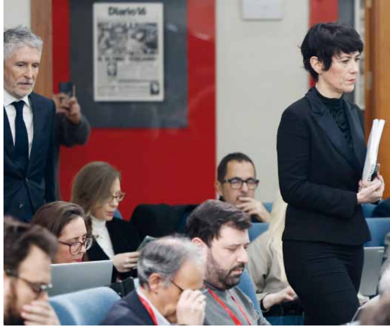
Giro en Europa. La ministra española de Migración, Elma Saiz, anunció la medida.

"En Estados Unidos en este momento hay millones de personas que tienen miedo en sus propias casas por que la policía migratoria de Trump entra en