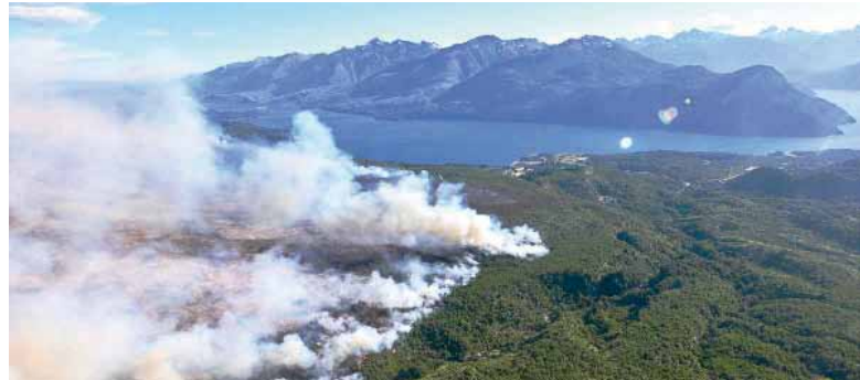
Investigados. La Justicia puso la mira en la responsabilidad de los funcionarios por los incendios en Chubut.

La Fiscalía de Esquel busca establecer si existió "incumplimiento de los deberes de funcionario público" en la respuesta estatal ante el incendio.