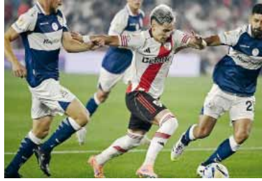
Áspero. El "Millonario" ante un rival de fuste.

El partido marcará, además, el reencuentro de River con su gente en Núñez, en una noche que promete gran convocatoria. Marcelo Gallardo repetirá el once inicial del debut, aunque seguirá sin poder contar con Franco Armani: el arquero continúa recuperándose de una molestia en el talón y será nuevamente reemplazado por