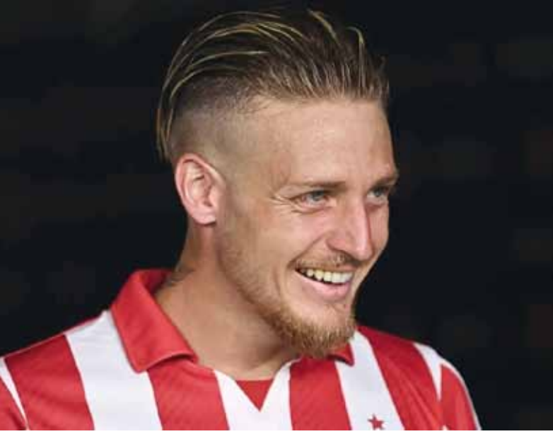
Sonríe. El "Ruso" cumple su sueño de vestir la azul y oro.

De esta manera, Boca suma a un jugador con recorrido internacional y conocimiento del medio local, en un mercado de pases en el que el club busca reforzar sectores clave del equipo de cara a la competencia.