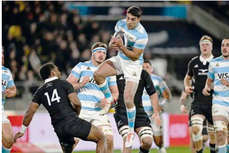
Alta en el cielo. El Seleccionado competirá en suelo nacional.

El debut en el flamante torneo será el 4 de julio, cuando Argentina reciba a Escocia en el Estadio Mario Alberto Kempes de Córdoba. Una semana después, el 11 de julio, San Juan albergará el cruce ante Gales en el Estadio del Bicentenario, mientras que el 18 de julio Santiago del Estero será escenario del duelo ante Inglaterra en el Estadio Único Madre de Ciudades, donde “Los” Pumas mantienen un historial per-