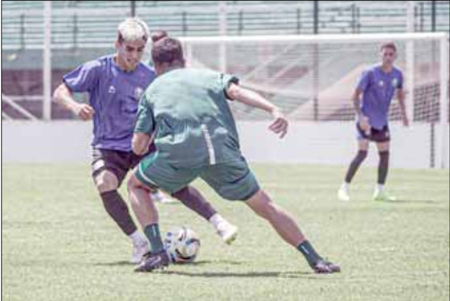
En pretemporada, el Celeste enfrentó a Sarmiento de Junín en aquella ciudad.

Y Gimnasia de Chivilcoy tendrá que verse las caras con Boca Juniors, en un choque previsto para el martes 24 del mes próximo.