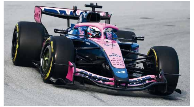
Test. Franco, durante los ensayos en Cataluña.

Completó las pruebas en Barcelona y volverá a girar en Baréin antes del inicio del campeonato.